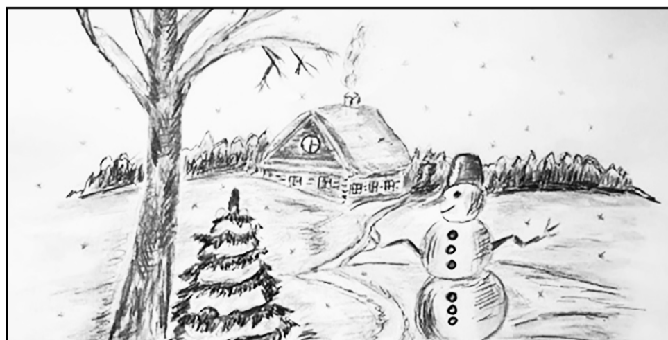
Рис. Мельниковой Златы, 2 А класс