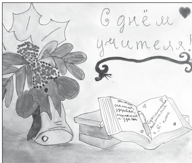
Рис. Сухомлиновой Анастасии, 4 В класс