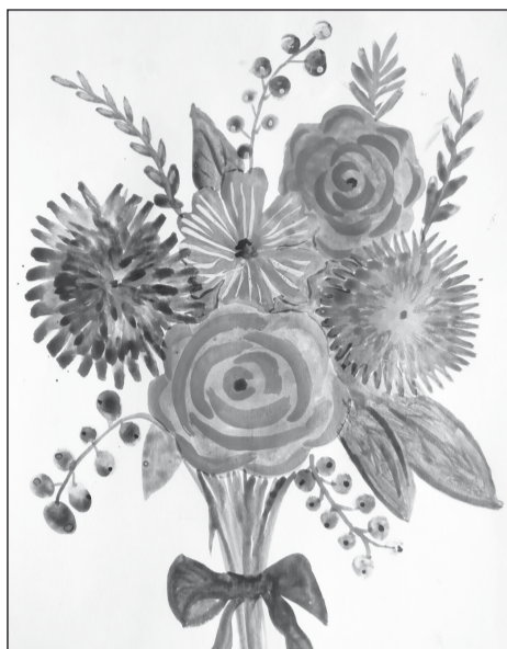
Рис. Сидоренко Веры, 1 Г класс

Кто нас учит? Кто нас учит? Кто нам знания даёт? Это школьный наш учитель – Удивительный народ. С ним всё ясно и светло, На душе всегда тепло. Вы простите, если в срок Был не выучен урок. От души мы поздравляем Наших всех учителей И здоровья всем желаем От проказников – детей!