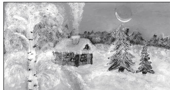
Рис. Съединой Анастасии, 4 Б класс