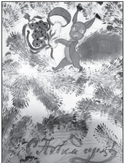
Рис. Сальниковой Дарьи, 5 Б класс