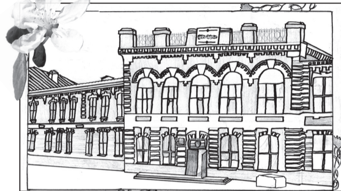
Рис. Литвин Галины, 6 В класс