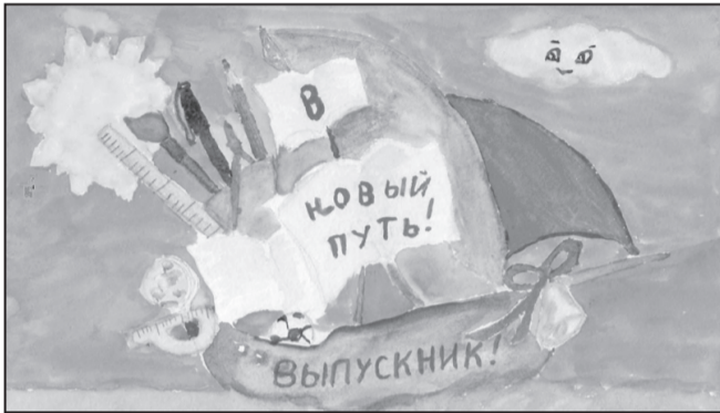
Рис. Молдован Дарьи, 3А класс

Дорогие наши выпускники! Звенит последний звонок - Это значит последний урок. Настало время расставаться, Но не надо огорчаться.